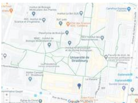
Plan du Patio → bâtiment 4 : faculté des langues

https://langues.unistra.fr/contact-et-plan-dacces/